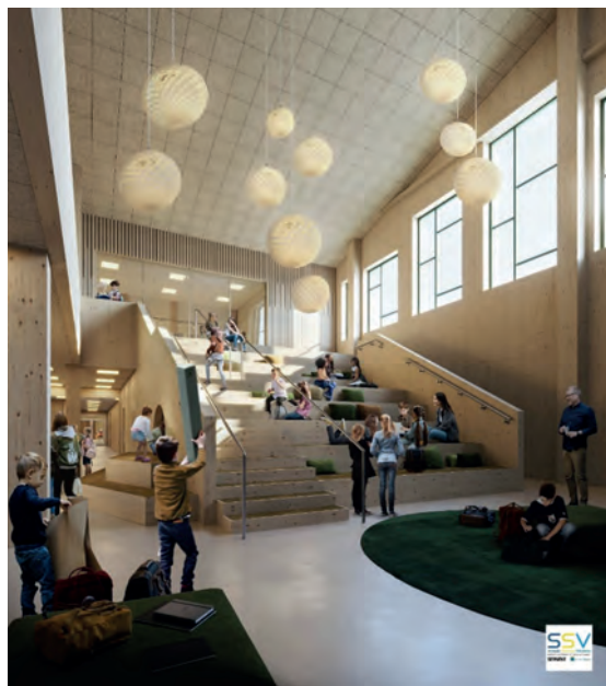
Tydliga inslag av trä, bild på det så kallade "hjärtat" i skolan.

Skolan planeras stå färdig till höstterminen 2024.